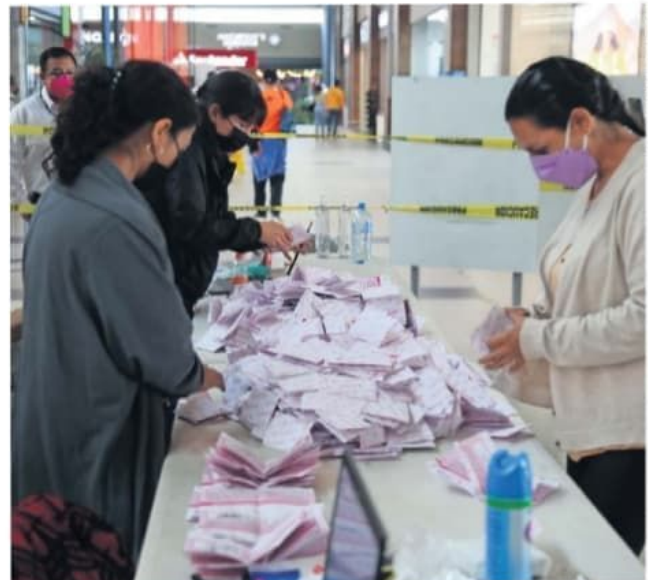
Para la consulta ciudadana fue necesario imprimir todo el material electoral, adquirir insumos sanitarios, instalar consejos locales y distritales, y capacitar a los funcionarios.

Por ley, para que la consulta resulte vinculante, era necesario que 40% de las personas registradas en la Lista Nominal salieran a votar, sin importar la opción que escogieran.